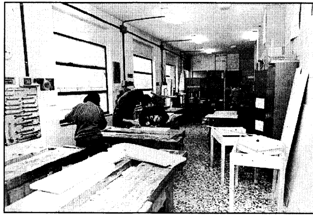
Il Centro Enaip di Carvico (a sinistra); a destra, nel reparto falegnameria dello stesso Centro.